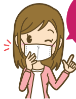
2月号 読者プレゼント キーワード 早めの対策

多くの人が悩まされる花粉症。でも、以前と違って眠くならないお薬もたくさんあり、治療法も進歩しています。また、グッズや花粉情報を得るツールもそろい、私たちを支えてくれています! 陽気もよくなるこれからの季節。花粉症と上手に付き合って、楽しく毎日を過ごしたいですね!