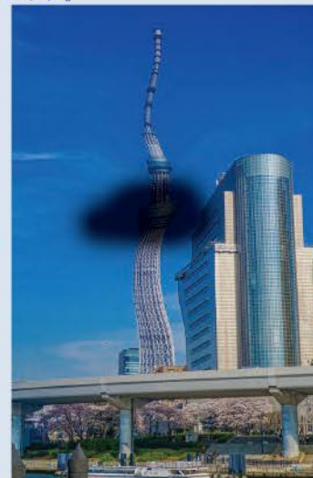
図2. 加齢黄斑変性の症状 ▶中心部のゆがみと中心暗点

網膜の腫れや網膜の下に液体が溜まると網膜がゆがみます。ゆがんだ網膜で、見ると物がゆがんで見えます(変視症【図1】)。黄斑部は障害されず、ゆがんだ網膜で、見えて見えますが周辺部は正しく見えます。さらに黄斑部の網膜が障害されると真ん中が見えなくなり中心暗点、視力が低下します【図2】。視力低下が進行すると運転免許の更新や字を読んだりすることが出来なくなります。