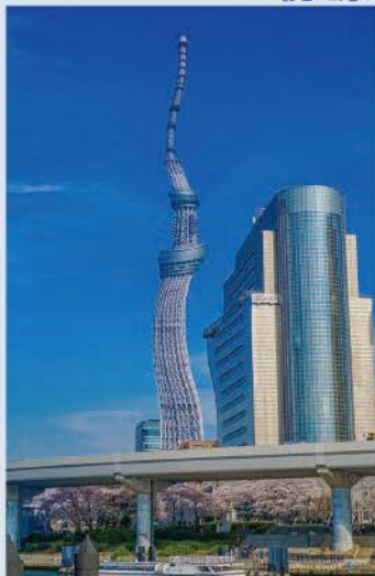
図1. 加齢黄斑変性の症状 ▶中心部のゆがみ