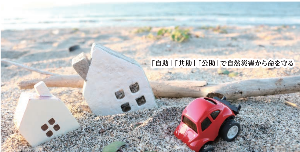
「自助」「共助」「公助」で自然災害から命を守る

●発行部数 52,000部/福島民報、毎日新聞へ折込 ●本誌の設置にご協力いただけるショップ・施設等を随時募集しております。詳しくは編集室までお問合せください。