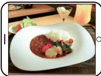
La暮らしスタッフおすすめ

リラククス整体院草野店 ☎0246-34-7739 整体サーキットドンキ店 ☎0246-28-8883 もみほぐし整体院大原店 ☎0246-54-8871 【詳しくはP3の広告をご覧ください】