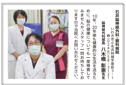
石井脳神経外科 眼科病院

脳の病気は発症前に予防すること、生活習慣を改善すること、これらがとても大事です。10年、20年後に元気でいられるために、一緒に健康づくりをしましょう！