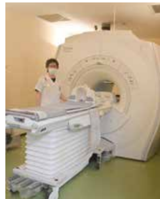
【MRI】磁気共鳴を利用し脳の断面をみる頭部MRIと脳の血管をみる頭部MRAなどがあります

脳の機能障害は、たとえ生命の危機を回避できたとしても、その後の人生に大きなダメージを与え、手術やリハビリなど、家族にも精神的・経済的な負担を強めます。