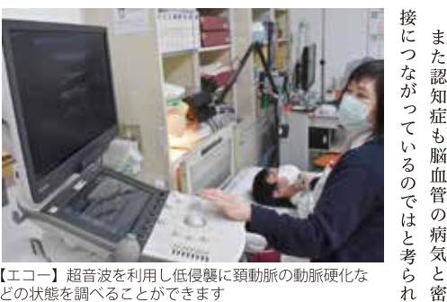
【エコー】超音波を利用し低侵襲に頸動脈の動脈硬化などの状態を調べることができます

血管狭窄、脳動脈瘤など大きな病気につながる異常も、早い段階なら大事に至る前に治療を始めることができます。喫煙や飲酒習慣のある30〜50代の方にも、ぜひ受診してほしいです。