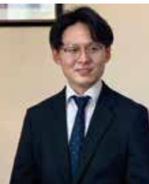
大きな変化が大きなストレス

「4月、新年度の始まりは、環境の変化をもたらします。進学・就職や異動・昇進などによる周りの人や環境の大きな変化は、私たちにとって大きなストレスとなります。変化に適応しようとして頑張った結果、無理が出て、ストレス反応が生じるのです」