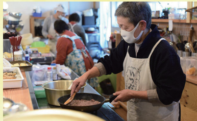
介護や福祉のプロとともに本格料理人もボランティアで厨房に立ち、おいしさは折り紙つき。

「食材をシェア」「スペースをシェア」「悩み事をシェア」。いつだれkitchenが掲げるモットーです。 お代は「投げ銭制」。置かれた瓶に、食べた人が思い思いの金額を入れていきます。もちろん入れなくても大丈夫なスタイルです。