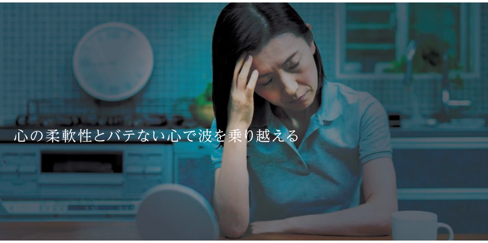
心の柔軟性とバテない心で波を乗り越える