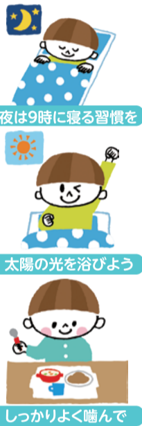
夜は9時に寝る習慣を

ここまでお伝えしてきた「こどもの健康」ですが、いかがだったでしょうか。子育てには、様々な悩みが付きものです。その中でも、健康は決して小さくはない関心事だと思えます。今回は、日常のちょっとしたことや、知っておいて損はないものを中心にまとめてみました。こどもの健康に、お役に立てれば幸いです。 さて、最後は番外編。急なこどもの病気のときに、頼れる味方をご紹介します。