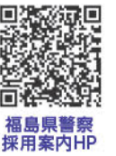
福島県警察採用案内HP

福島県警察では、男性・女性職員とも子育てのために利用できるサポート制度や福利厚生が充実しており、多くの職員が制度を利用して、仕事と家庭を両立しています。試験に関する情報、警察の仕事や福利厚生に関する制度など、詳しい情報を知りたい方は、いわき中央警察署までご連絡ください。