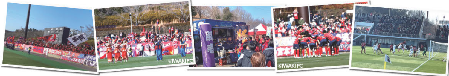
サッカーJ2は2月18日に開幕し、いわきFCは初舞台での初戦に臨みました！22チームがしのぎを削るJ2で、11月12日まで全42試合の闘いを繰り広げます。今シーズンの試合日程は右のQRコードからご覧ください。

たくさんの方に試合を見てもらいたいですし、見に来てよかった、また来たいと思えるようなプレーを皆さんに披露出来るように全力で戦いたいです。